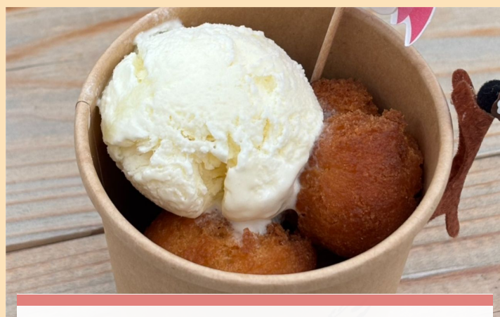
サーターアンダギーカップ