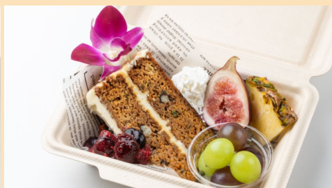
キャロットケーキ